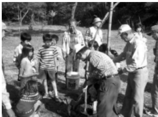
写真；ノダフジの植え付け

準備段階は雨の日が多く、植樹場所の整備や土産の麦茶づくりなどが延び延びになってヤキモキしましたが、皆さんの奮闘でこぎつけると、当日はうって変わり暑いほどの好天。210名という多くの参加者で、楽しい1日をすごすことができました。