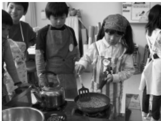
西生田小学校での麦茶作り